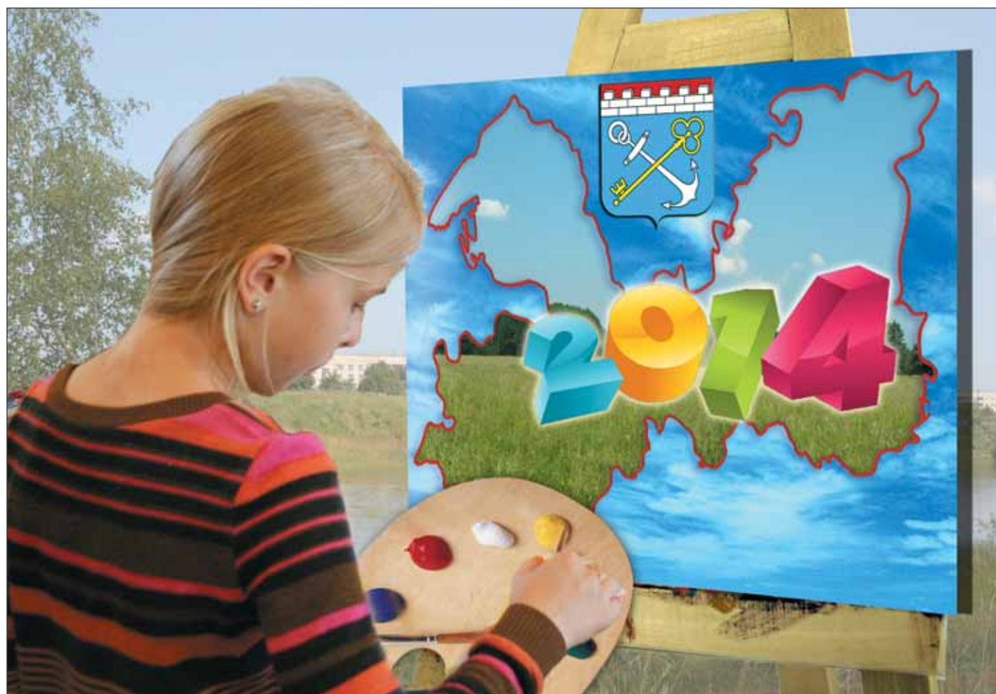
Коллаж Ирины МАКСИМЕНКО

В Ленинградской области традиционно уделяется особое внимание детям. Неудивительно поэтому, что школа нашего региона считается одной из лучших в России. Пристальное внимание и помощь многодетным семьям, постоянная забота об одаренных ребятах, действенный надзор за детьми-инвалидами. Это лишь малая часть того, что делается в регионе в защиту детства. Четвертый гражданский форум Ленинградской области «2014-й – Год детства», состоявшийся в минувшую среду, был посвящен подрастающему поколению.