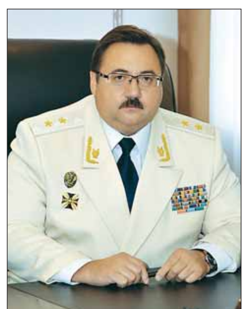
ли какие-то положительные тенденции?

– И все-таки какие проверки проводились органами прокуратуры Ленинградской области в текущем году, в том числе в отношении представителей власти? Есть