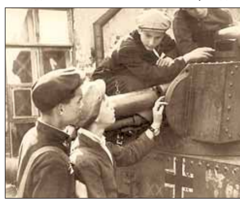
Ленинградские дети у трофейного немецкого танка.

Мама и Настя ходили по магазинам, которые были практически пусты. Только где-то продавали консервы — крабы. Они купили, кажется, шесть или восемь банок этих крабов. Все это помогло нам выжить в самые голодные месяцы, в декабре 1941 года — феврале 1942 года, когда от голода умирали целые семьи. Умер и наш дядя Лева, мамин дядя, которому было около семидесяти лет.