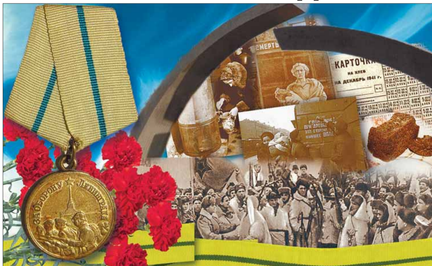
Коллаж Ирины МАКСИМЕНКО

Вчера в здании администрации Ленинградской области прошло первое в этом году заседание областного Правительства.