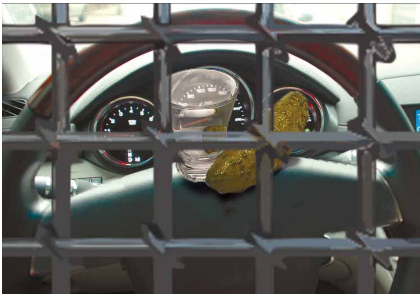
Коллаж Ирины МАКСИМЕНКО

Управление автомобилем в состоянии алкогольного опьянения вскоре может стать уголовно наказуемым. Поправки в законопроект, ужесточающий наказание за езду в пьяном виде, должны были быть рассмотрены 20 ноября, но из-за возникших у юристов и депутатов вопросов сроки сдвигаются на конец этого года.