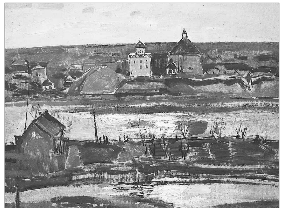
Картина Вячеслава Францевича Загонка «Волхов. Собор и крепость» (1973)

Все-таки в советское время государство очень умно взаимодействовало с творческим союзом и создавало стройную систему обеспечения художников заказами. Была система искусствоведов-реализаторов. Они выезжали на предприятия, дома культуры, музеи, выявляли, есть ли у нас возможности заказывать картины высокого уровня. И в конце 1970-х годов у нас пошли комплексные заказы на художественный фонд, в том числе художников, графиков, скульпторов, монументалистов. На 80% эти рабо-