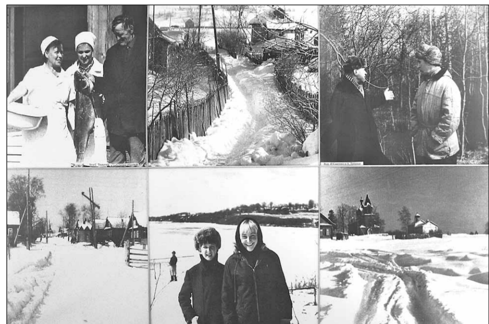
Фотопанно, посвященное жизни художников в Старой Ладоге