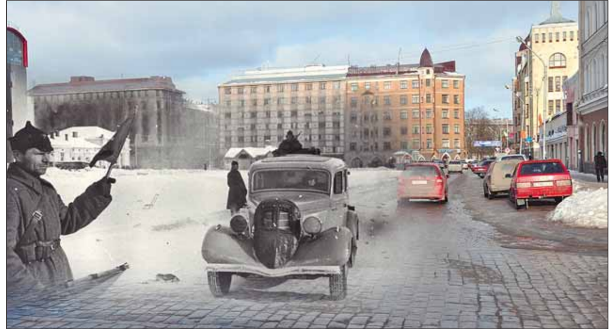
Коллажи Сергея Ларенкова.