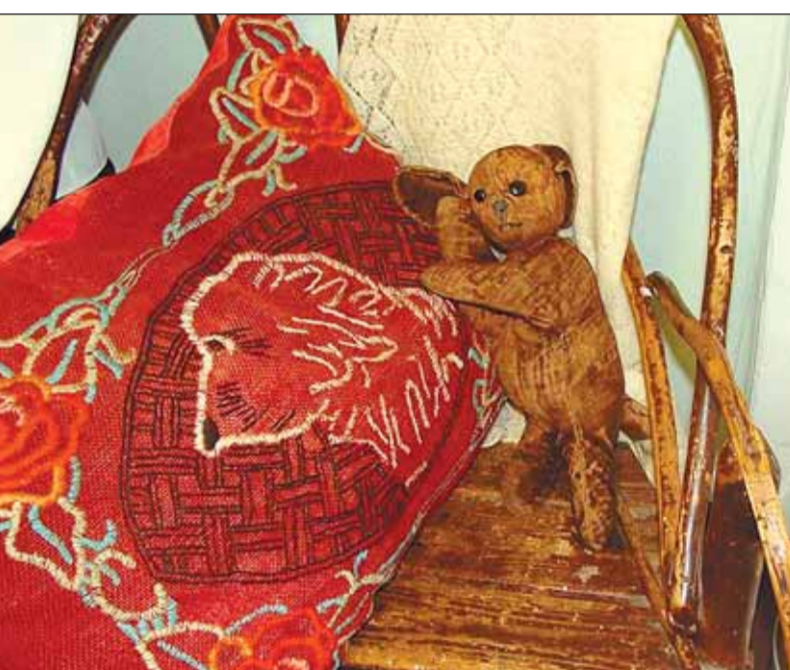
«Трофейная» подушечка и парголовский мишка