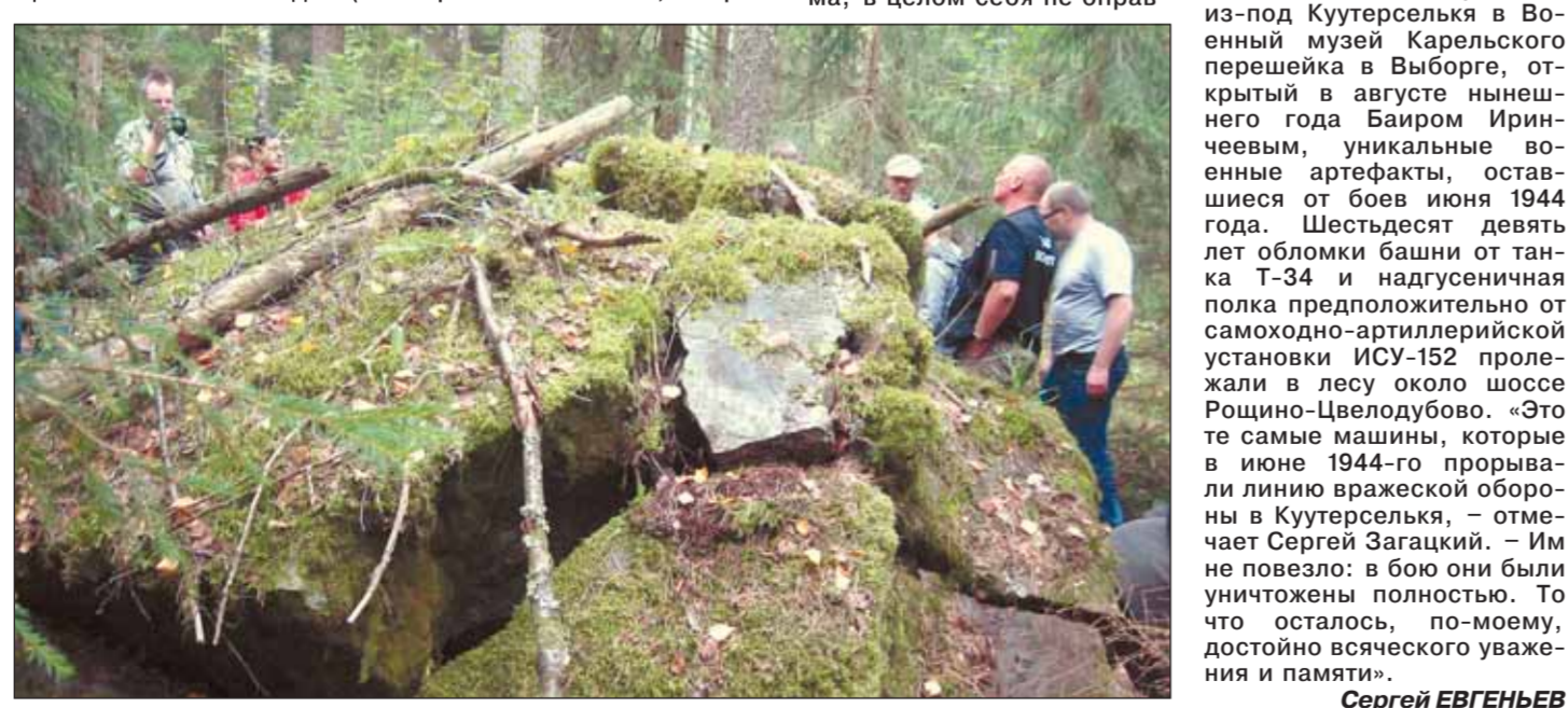
Взорванные железобетонные убежища на линии ВТ у шоссе Цвелодубово – Роцино