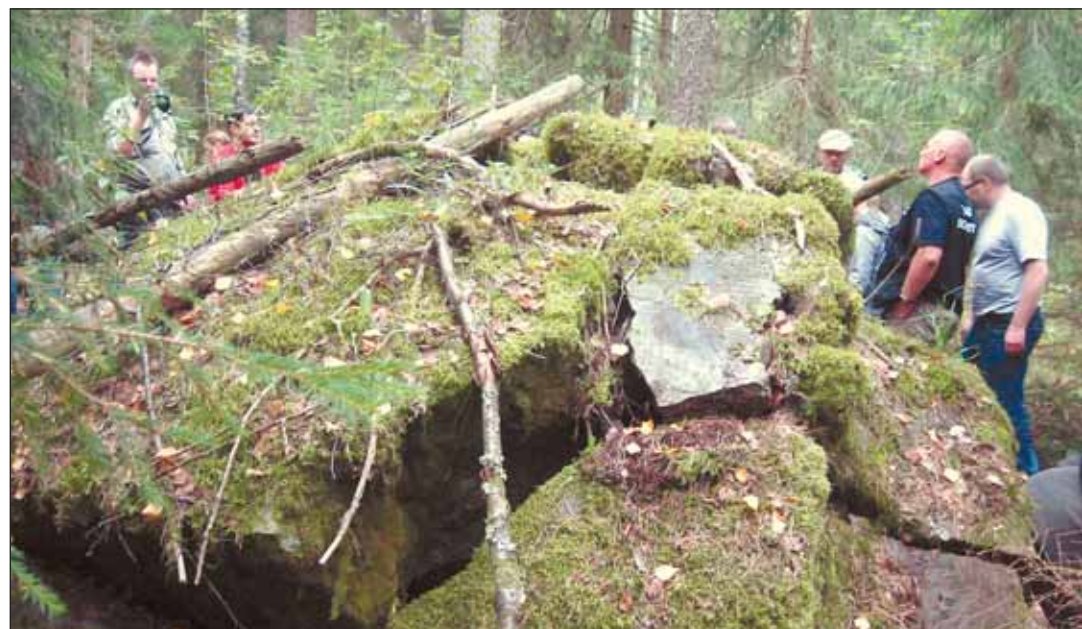
Взорванные железобетонные убежища на линии ВТ у шоссе Цвелодубово — Рошино

Заявка на участие в аукционе принимается с 16 сентября 2013г. с 10-00 до 16-00 (перерыв с 13-00 до 14-00) по адресу: Санкт-Петербург, ул. Смольного, дом 3, оф. 1-29. Прием заявок прекращается 11 октября 2013 г. в 16-00. Участники аукциона определяются 17 октября 2013 г. в 11-00 по адресу: Санкт-Петербург, ул. Смольного, дом 3, оф. 1-31. Регистрация участников аукциона проводится 01 ноября 2013г. с 11-00 до 11-20 по адресу: Санкт-Петербург, ул. Смольного, дом 3, оф. 1-29. Начало аукциона и подведение ито-