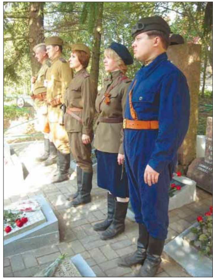
Почетный караул на братской могиле в Лебяжье

В ноябре прошлого года поисковики подняли здесь останки четверых солдат. Тогда, в 44-м, двоих бойцов просто стащили в воронку после боя и засыпали песком, а еще двое так и остались в своем окопе. Мне и сейчас иногда снится тот парень, что 69 лет простоял на коленях на дне стрелковой ячейки, закрыл