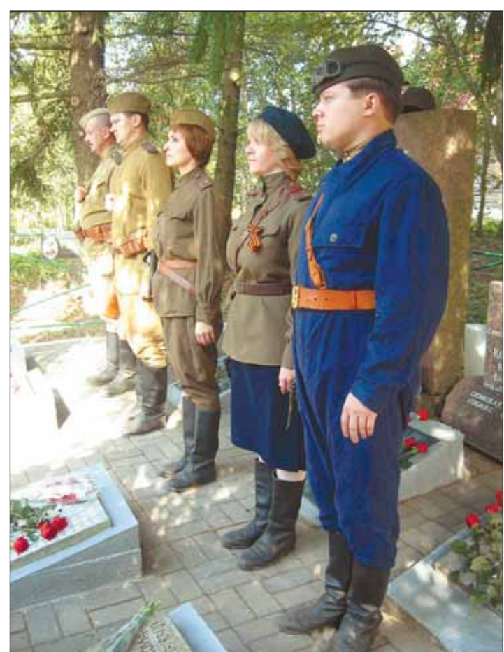
Почетный караул на братской могиле в Лебяжье

В ноябре прошлого года поисковики подняли здесь останки четверых солдат. Тогда, в 44-м, двоих бойцов просто стащили в воронку после боя и засыпали песком, а еще двое так и остались в своем окопе. Мне и сейчас иногда снится тот парень, что 69 лет простоял на коленях на дне стрелковой ячейки, закрыл