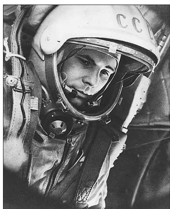
Почти неделю доставил немало неприятных минут Госкомиссии.

В конце марта заведующему отделом обороны ЦК партии из штаба ВВС пришло два набора фотографий. Юрий Гагарин и Герман Титов были сняты как в военной, лейтенантской форме, так и в гражданском. Был приложен и листок с биографиями. Конечно же, в оборонном отделе определить, кому именно лететь, не могли. Фотографии начали свое путешествие «по инстанциям». В конце концов они легли на стол Н.С. Хрущеву. Тому понравился и тот и другой. «Решайте сами!» – сказал он. – Мне нравятся оба!» Мнение главы партии и правительства немедленно было передано на космодром. И тогда все поняли, что первым лететь Юрию Гагарину – он явно импонировал С.П. Королеву. Официально основным пилотом «Востока» Гагарин был объявлен 8 апреля. Вечером 10 апреля состоялось торжественное заседание Государственной комиссии. От технического руководителя пуска ждали, что он подробно расскажет о подготовке корабля и носителя, о комплексных испытаниях. Неприятности были, и еще накануне СП в довольно резких выражениях отчитывал и рядовых инженеров, и главных конструкторов. Несколько раз звучало знаменитое королевское: «Отправлю в Москву по шалапам!» Да, сейчас ему представлялась прекрасная возможность детально проанализировать все свои в подготовке к пуску и, не выходя из кабинета, публично «дать перцу» всем, кто в предст-