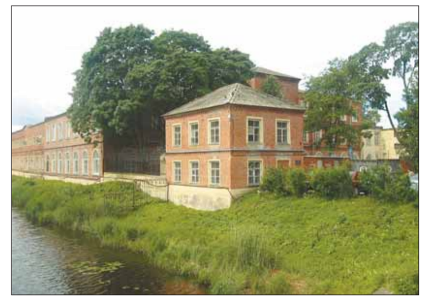
Старинное двухэтажное кирпичное здание на берегу Малоневского канала – это и есть Музей истории города Шлиссельбурга

В записке Кондрашова сообщалось также об ужасающем