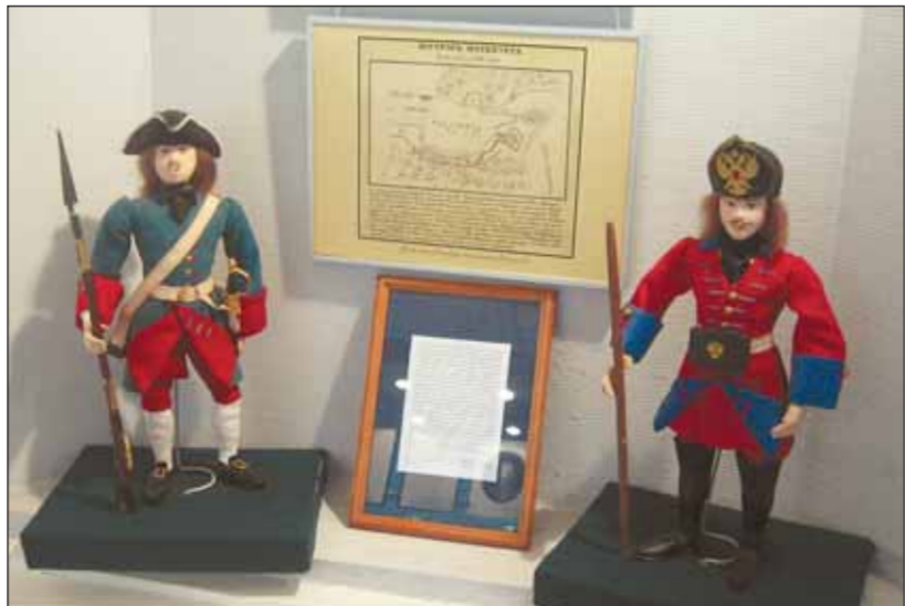
Экспонаты музея, рассказывающие о петровской эпохе