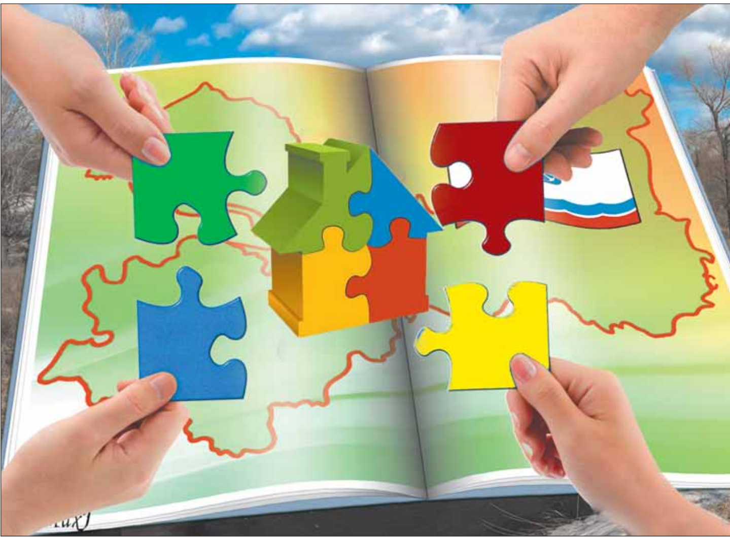
Коллаж Ирины МАКСИМЕНКО

Комитет по местному самоуправлению, межнациональным и межконфессиональным отношениям Ленинградской области разработал концепцию реформирования территориальной организации местного самоуправления 47 региона.