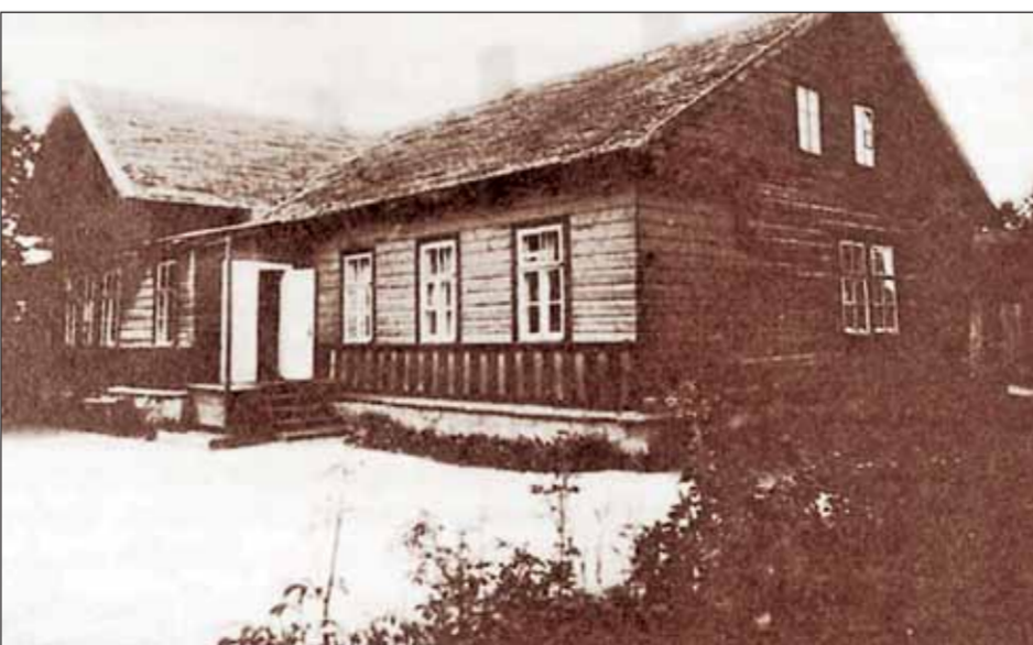
Учительская семинария (старое здание) в Малых Колпанах. 1910 г.